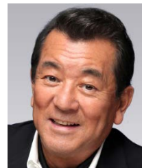
俳優・歌手 加山 雄三 以前から環境問題への関心が強く、自ら、海洋環境クリーンプロジェクト【海その愛基金】を立ち上げるなど、新エネルギーの普及活動を精力的に行っている。