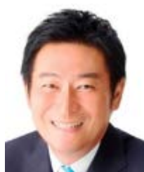
環境省 環境副大臣 衆議院議員 あきもと 司