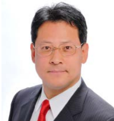
経済産業省 経済産業副大臣 衆議院議員 関 芳弘