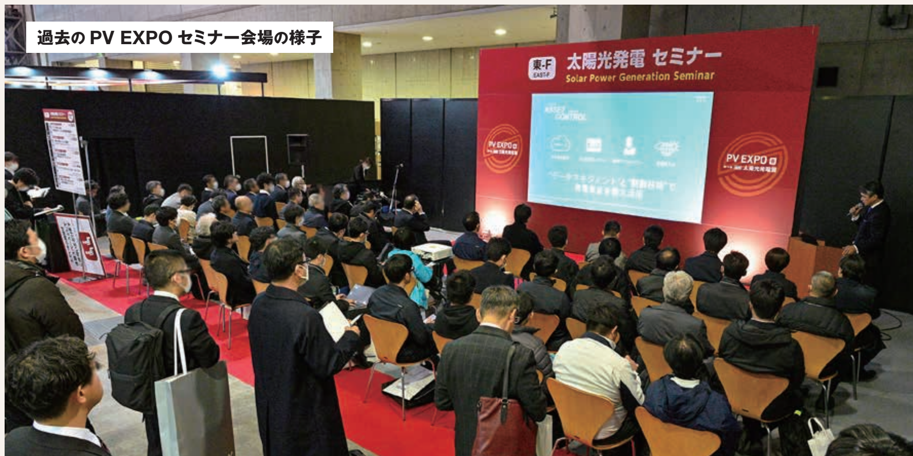
過去のPV EXPO セミナー会場の様子