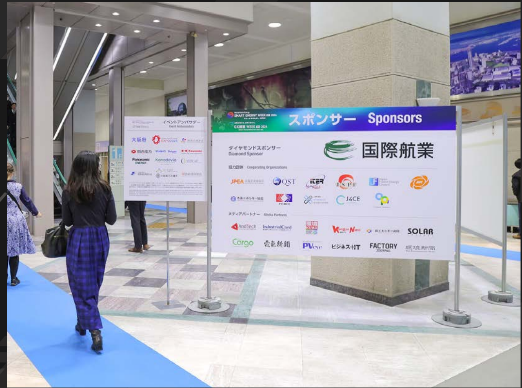
■会場前メイン通路内